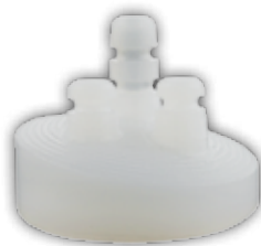
8° posterior augmentiertes Zapfenglenoid (PE)