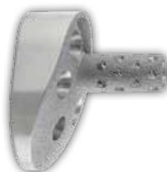
10° superior augmentierte Glenoidplatte

Anspruchsvolle Glenoidsituationen verlangen nach Implantatlösungen, die sich dem spezifischen Defekt widmen. Das Equinox Schulterssystem bietet Ihnen diese Lösungen mit den entsprechenden Glenoidimplantaten für Primär- und Reverseversorgungen.