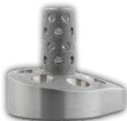
8° posterior augmentierte Glenoidplatte