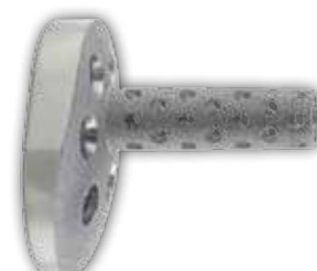
Glenoidplatte mit verlängertem Hohlzapfen