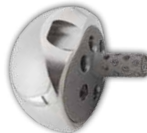
lateralisierte Glenosphäre (+4mm)

Exactech verfügt über ein umfangreiches Netz an Distributoren rund um den Globus. Weitere Informationen über Exactech Produkte in Ihrem Land erhalten Sie auf www.exac.com .